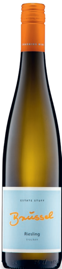
Beispielhafte Abbildung unserer Ausstattung

Unsere Gutsweine werden in verschiedenen Lagen und Weinbergen gelesen. Es sind feine, fruchtig elegante Menüweine.